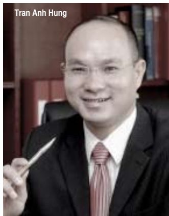
Tran Anh Hung

Inoltre, l'Italia, pur contribuendo in maniera rilevante ai progetti culturali e al recupero di beni artistici e siti archeologici in Vietnam, non appartiene al novero di Stati donatori - come Stati Uniti, Giappone e Germania - che finanziano grandi opere pubbliche vietnamite le quali verranno realizzate da appaltatori connazionali. Ad esempio, i progetti di costruzione delle linee metropolitane delle maggiori città vietnamite dovrebbero essere realizzati da progettisti e costruttori nipponici,